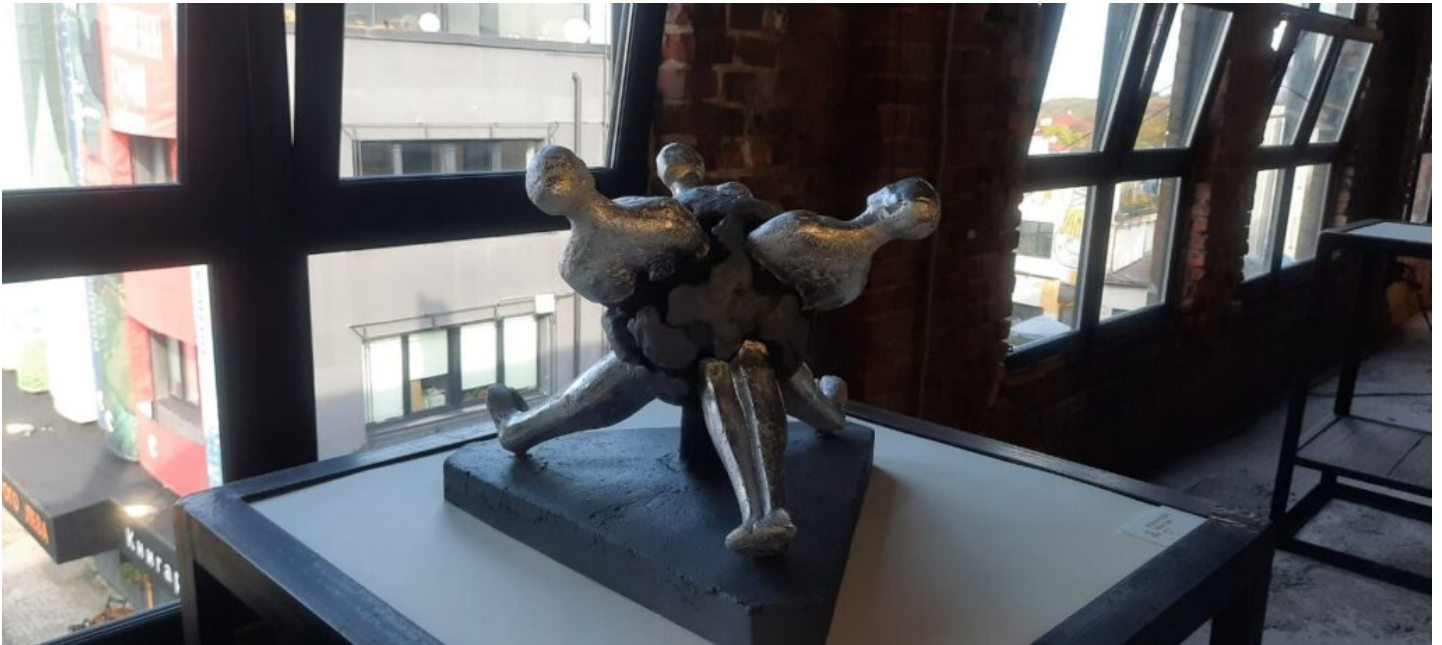
Усі фото: Galnet. Автор Ярослав Костко "Спільне ядро"

Перший «Lviv Art Week» добігає кінця. До його створення долучилися львівські мистецькі інституції, які продемонстрували фрагмент локального мистецького середовища. Відтак, подія відбувається під гаслом – «Віддалена взаємодія».