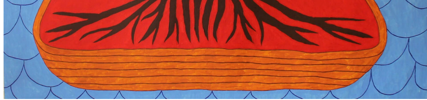
"Джерело невичерпних джерел"

Багато сюжетів Олена Каїнська бере із літератури (наприклад, Милорад Павич, Габріель Гарсія Маркес, Бруно Шульц) і трансформує їх у казкові наративи. На картині « Невичерпне джерело невичерпних джерел » (2017) мисткиня зобразила диво-птиць (схожих на сирен із грецької мітології), які оберігають вічне дерево життя. Воно мандрує морем у човні — лодії (традиційному слов'янському судні) — і черпає енергію з крові. З одного боку, це полотно — маніфестація ідеї, що все почалося з материнського лона, адже всі символи тут — суто жіночі, а сама композиція нагадує матку. З іншого, «Невичерпне джерело невичерпних джерел» наповнене відчуттям безпеки. Місяць і сонце, а разом із ними диво-птиці, оберігають джерело. Тут немає жодної загрози — навіть тривожне море не навіює небезпеки. Так наче глядач повертається у дитинство: «Мої картини по-дитячому прості і безпосередні, вони допомагають пригадати дитячий стан безпеки і довіри, стан цікавості до світу, казковості, любові. Так ніби тебе тримають на руках і розповідають казку. Ми забули відчуття безпеки, коли про нас турбуються і нас люблять» .