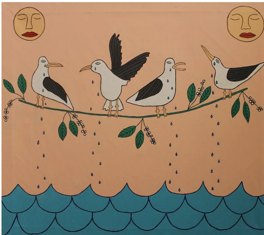
"Чайки наплакали море"

Багато сюжетів Олена Каїнська бере із літератури (наприклад, Милорад Павич, Габріель Гарсія Маркес, Бруно Шульц) і трансформує їх у казкові наративи. На картині « Невичерпне джерело невичерпних джерел » (2017) мисткиня зобразила диво-птиць (схожих на сирен із грецької мітології), які оберігають вічне дерево життя. Воно мандрує морем у човні — лодії (традиційному слов'янському судні) — і черпає енергію з крові. З одного боку, це полотно — маніфестація ідеї, що все почалося з материнського лона, адже всі символи тут — суто жіночі, а сама композиція нагадує матку. З іншого, «Невичерпне джерело невичерпних джерел» наповнене відчуттям безпеки. Місяць і сонце, а разом із ними диво-птиці, оберігають джерело. Тут немає жодної загрози — навіть тривожне море не навіює небезпеки. Так наче глядач повертається у дитинство: «Мої картини по-дитячому прості і безпосередні, вони допомагають пригадати дитячий стан безпеки і довіри, стан цікавості до світу, казковості, любові. Так ніби тебе тримають на руках і розповідають казку. Ми забули відчуття безпеки, коли про нас турбуються і нас люблять» .