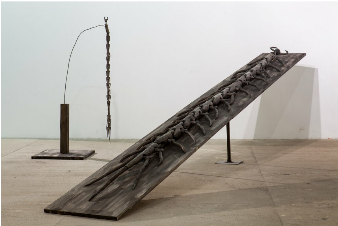
Один із дерев'яних об'єктів "Скалопендра"

Своє мистецтво Костянтин Зоркін пояснює так: «Для мене досить знати, що життя — це таємниця, а наші спроби розкрити її є найцікавішою грою. Мистецтво, напевно, найближче підбралося до кордону таємного і явного, тому той, хто став на шлях творчості, несе особливу відповідальність. Адже талант — це унікальна можливість контакту з невідомим, причому не тільки для художника, а й через нього, для глядача».