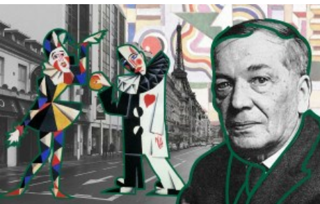
УКРАЇНЦІ ЗА КОРДОНОМ ЖИВОПИС