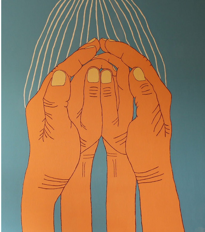
"Якщо ми будемо дуже тихими і дуже прозорими"

два сонця, дарують відчуття захисту. У творчості Олени Каїнської це частий мотив — сутність, яка захищає з обох верхніх кутів полотна, нагадує шаманський оберіг.