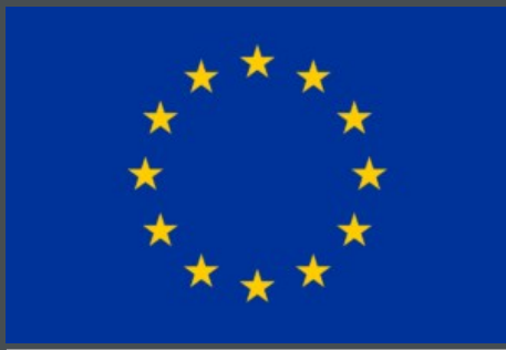
Проект фінансується Європейським Союзом